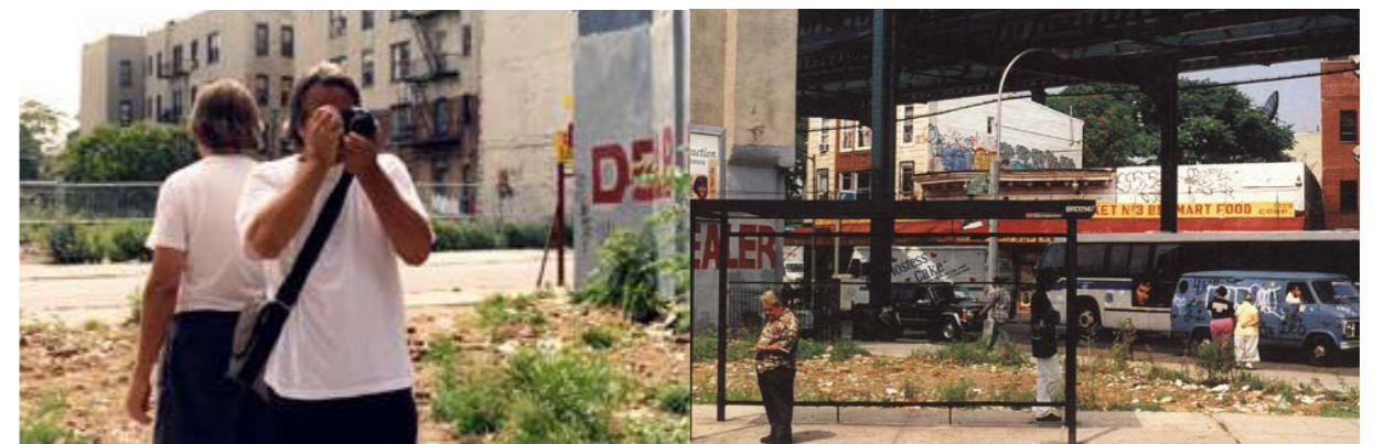
© Laurent Malone et Dennis Adams